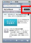
MySoftbankから ログアウトをする