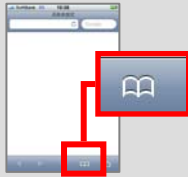
ブックマークから MySoftbankを選択