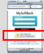
「初めてお使いの方 パスワードを忘れた方」を選択