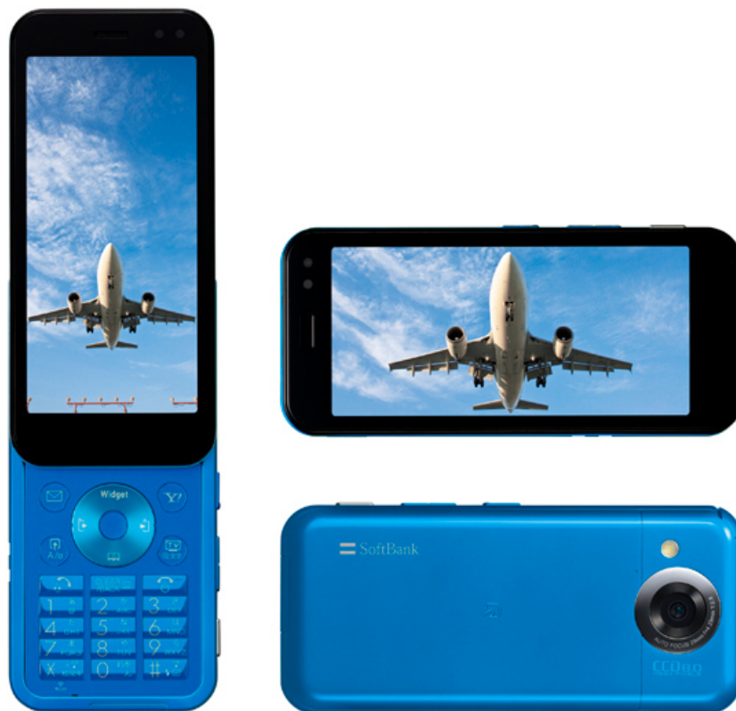
アジュールブルー