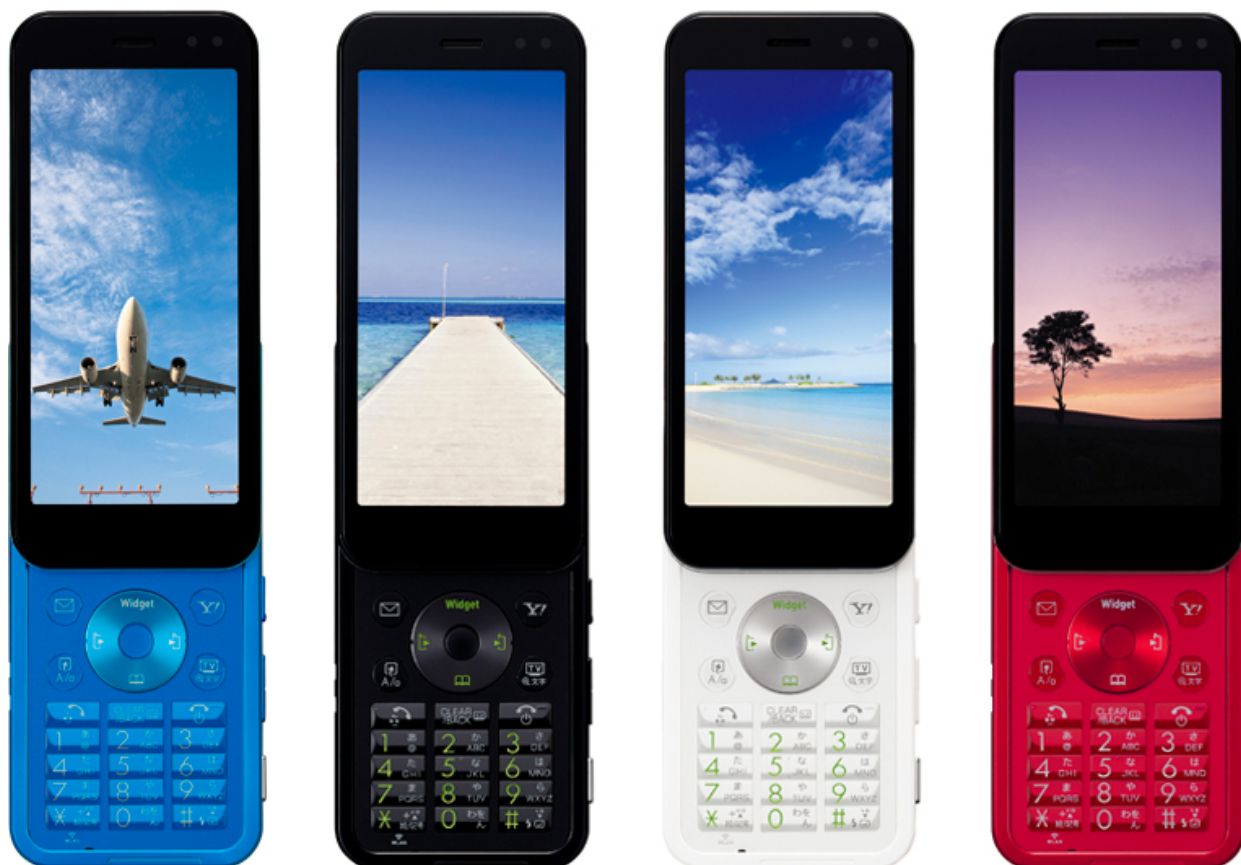
左から、アジュールブルー / ブラック / ホワイト / レッド