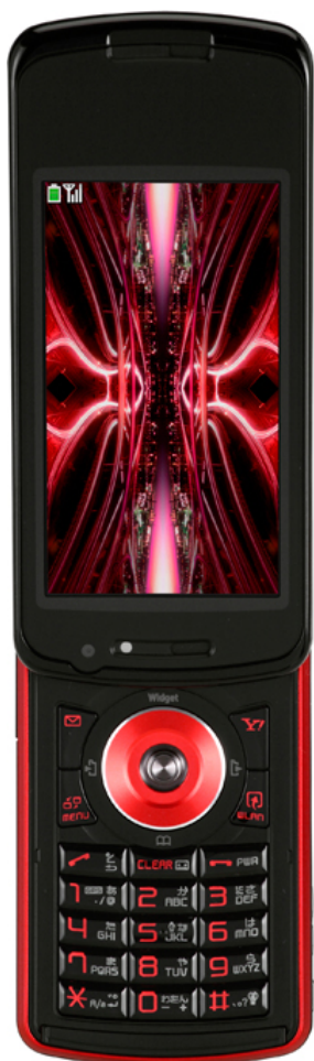
コミュニケーションスタイル