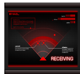
【着信、メール受信画面等】