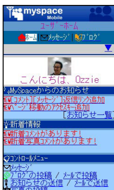
©2003-2007 MySpace.com. All Rights Reserved.